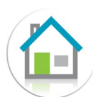
Mon chez-moi demain