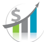
Ma situation financière