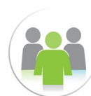
Ma participation sociale