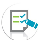
Mon second projet de vie